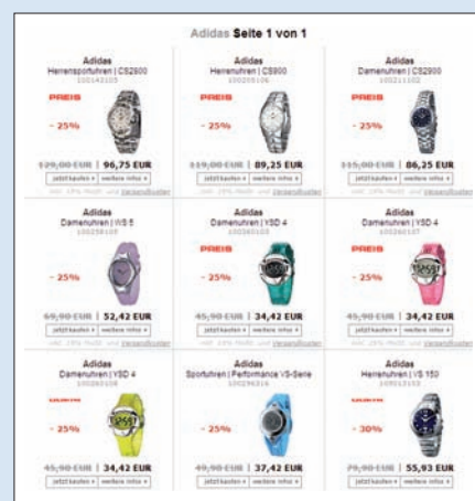
Aufgeräumt wirkt die Uhren-Präsentation

den interessierten User Klick für Klick zum Produkt führen. Die Produkte sind sehr groß dargestellt und vermitteln einen guten Eindruck. Leider gibt es immer nur eine Abbildung je Produkt. Bei diesen hochpreisigen Artikeln wären mehrere Abbildungen, eine Zoomfunktion oder eine 3-D-Animation wünschenswert. Die Produktbeschreibung ist äußerst detailliert und macht durch sehr gute Icons die einzelnen Eigenschaften transparent. Wenn die Eigenschaften aber bereits so detailliert aufgesplittet werden, könnte man auch eine Funktion dazu aufnehmen, etwa vergleichbare Uhren mit diesen Eigenschaften, die Suche nach diesen Eigenschaften, die Suche nach Filtermöglichkeiten. Die Suche erkennt Tippfehler und liefert Ergebnisse. Aber auch die Ergebnisse aus der Suche lassen sich nicht mehr sortieren oder filtern. Bei vielen Ergebnisprodukten wird der User sein Wunschprodukt kaum finden können. Der Bestellprozess ist einfach strukturiert und leicht verständlich. Kaum ein Bestellprozess in einem Shop erwies sich als so eingängig. Die Performance des Shops überzeugt. Selten haben wir einen so schnellen Shop getestet. Hier macht das Surfen und Stöbern richtig Spaß!